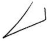
גילה כנפי-שטייניץ שופטת