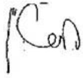
אלכס שטיין שופט